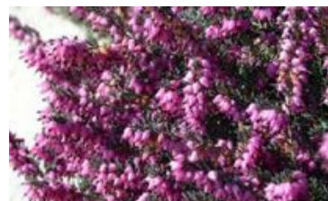
Erica carnea