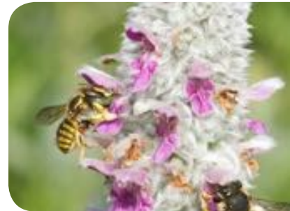
Anthidie sur inflorescence de Stachys byzantina

Ce ne sont ici que quelques exemples parmi d'autres, mais on le voit, nos pollinisateurs ont besoin de beaucoup plus que de quelques fleurs pour boucler leur cycle de vie... et tout l'enjeu des aménagements est de comprendre ces « réseaux écologiques » qui rendent interdépendantes les espèces animales et végétales de notre environnement pour mieux renforcer leur présence.