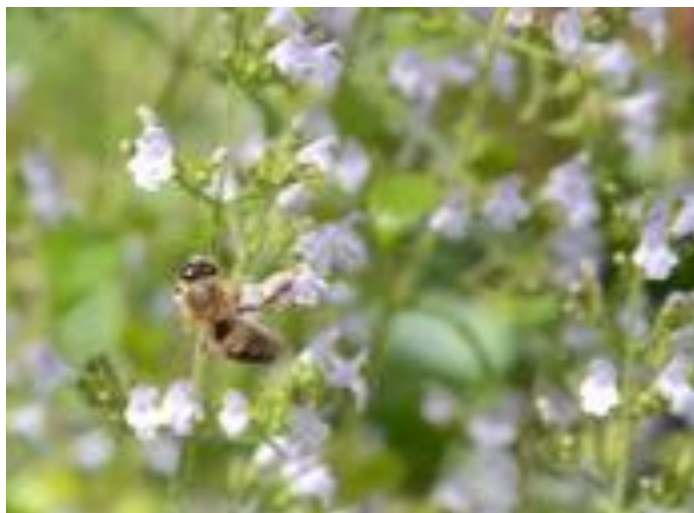
Calamintha nepeta & Apis mellifera