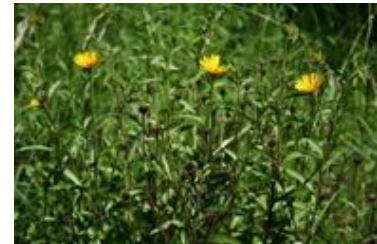
Bupthalmum salicifolium