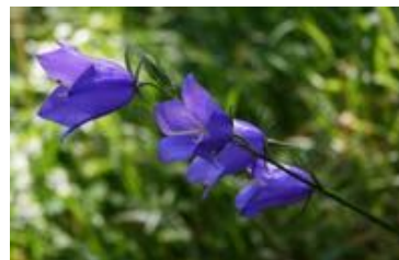
Campanula persicifolia