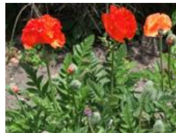
Papaver orientale