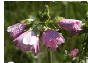
Malva moschata