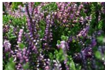
Calluna vulgaris