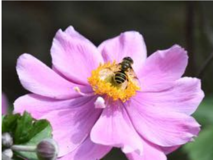
Anemone hupehensis & Eristalis