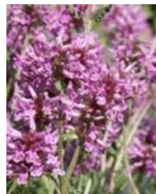
Stachys officinalis