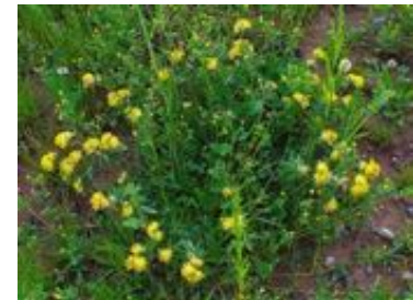
Anthyllis vulneraria