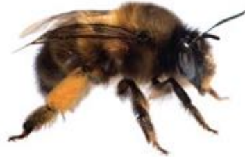
Anthophora plumipes femelle