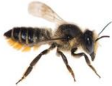
Megachile centuncularis femelle