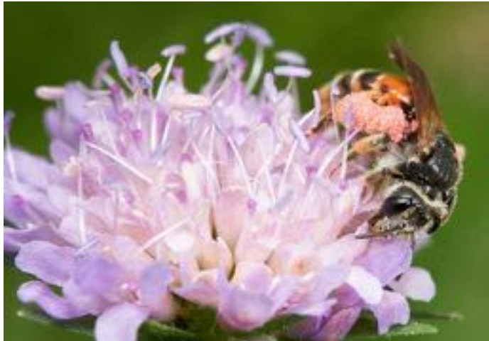
Knautia arvensis & Andrena hattorfiana