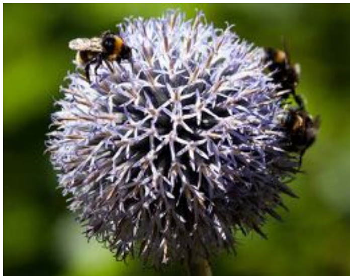
Echinops sphaerocephalus & Bombus terrestris