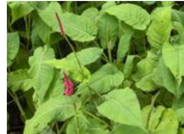
Persicaria amplexicaulis