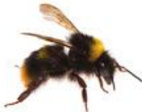
Bombus pratorum Bourdon des prés