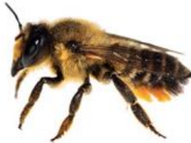
Megachile willughbiella femelle