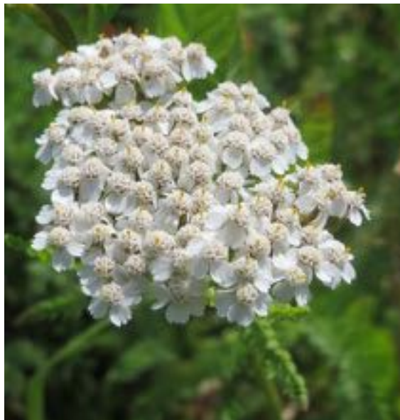
Achillea millefolium