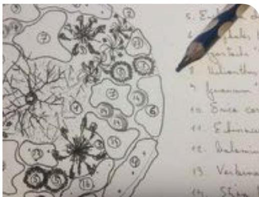
Plan de plantation

Indispensable pour réussir son massif, le schéma de plantation permet de poser une réflexion qui prendra en compte les hauteurs des fleurs, le feuillage, les volumes et les couleurs à associer. Il tiendra compte également des distances de plantation entre les différents plants. Il est en effet toujours difficile d'imaginer, à partir des jeunes plantes cultivées en godets, le développement qu'elles prendront par la suite.