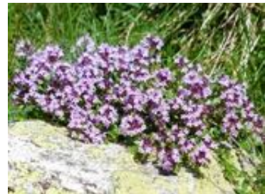
Thymus praecox