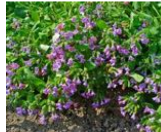
Pulmonaria officinalis