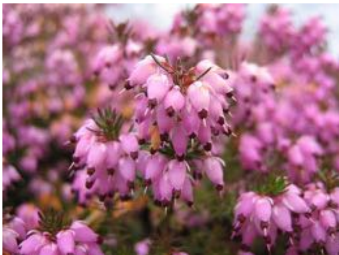
Erica carnea