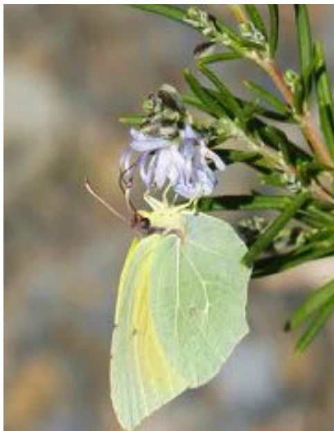
Rosmarinus officinalis & Gonepteryx rhamni