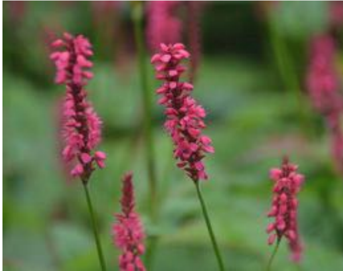
Persicaria amplexicaulis © P. Colomb