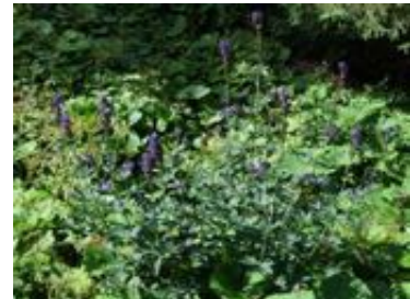
Delphinium elatum