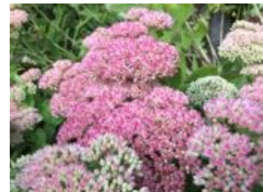
Sedum spectabile