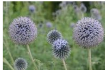
Echinops sphaerocephalus