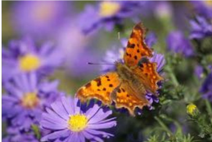
Aster cordifolius & Polygona c-album (Robert le diable)