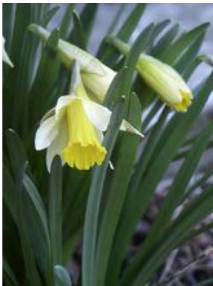
Narcissus pseudonarcissus