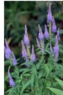
Veronica longifolia