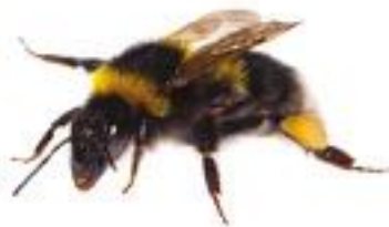
Bombus hortorum Bourdon des jardins