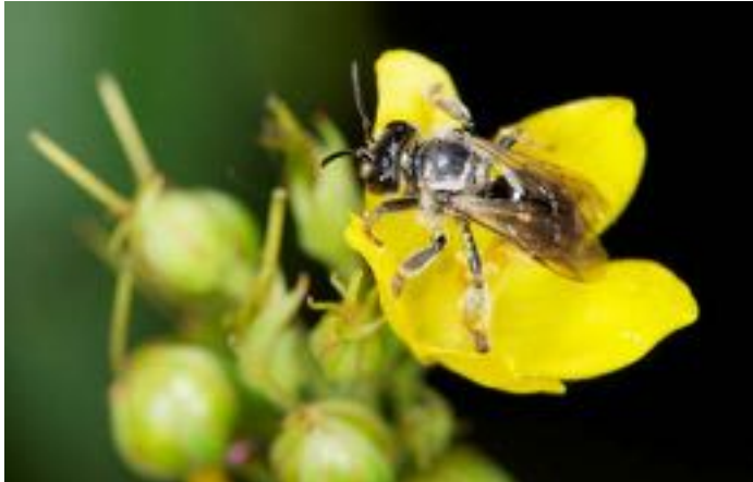
Lysimachia vulgaris & Macropis europaea