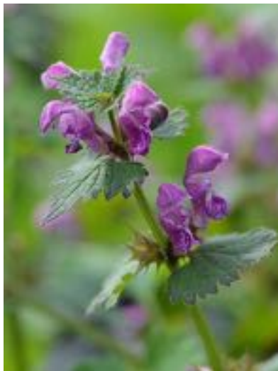
Lamium maculatum