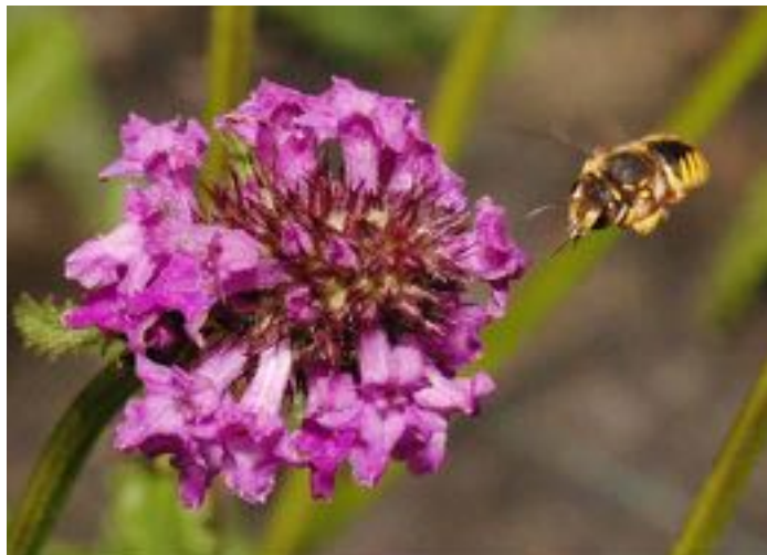
Stachys officinalis