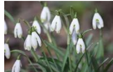
Galanthus nivalis