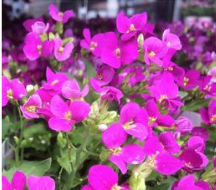
Arabis caucasica