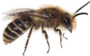
Colletes daviesanus mâle