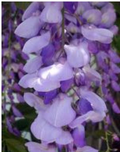
Wisteria sinensis