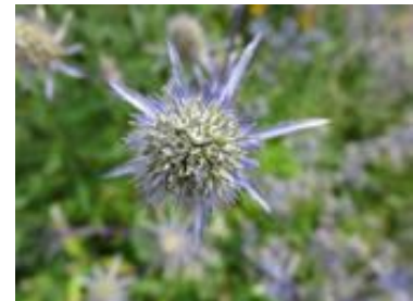
Eryngium planum