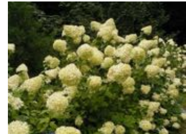
Hydrangea paniculata