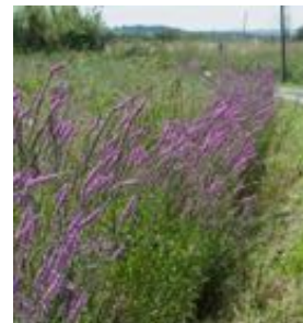
Lythrum salicaria