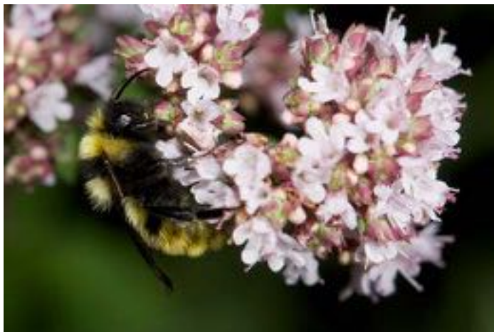
Origanum vulgare & Bombus campestris