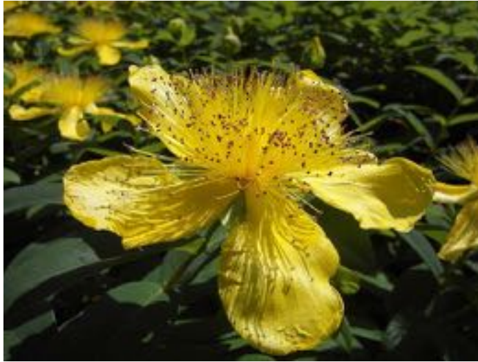
Hypericum calycinum