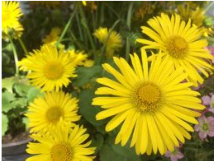
Doronicum orientale