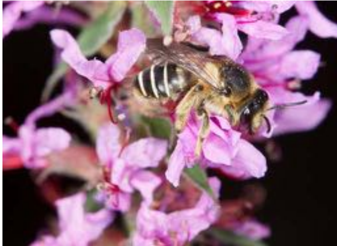
Lythrum salicaria & Melitta nigricans