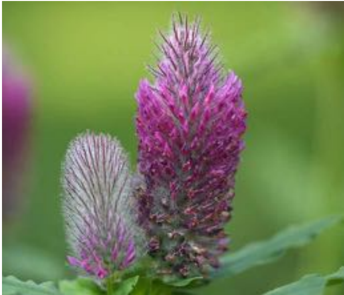
Trifolium rubens