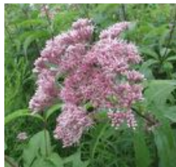
Eupatorium maculatum