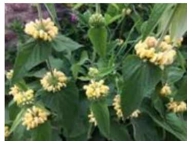
Phlomis fruticosa