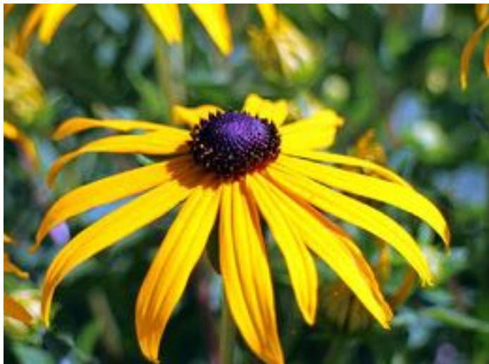
Rudbeckia fulgida