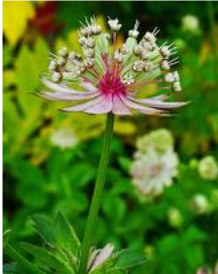
Astrantia major