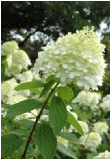
Hydrangea paniculata