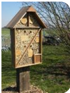
Tronc perforé pour les abeilles sauvages

- l'hôtel à abeilles sauvages qui est un aménagement très populaire. Il ne s'agit pas d'une ruche comme celle de l'abeille mellifère, mais d'un ensemble de matériaux offrant aux abeilles sauvages des anfractuosités (tiges creuses, bois foré, tiges à moelle tendre) dans lesquelles elles aménageront leurs nids, qu'elles approvisionneront avec un mélange de pollen et de nectar. Certaines guêpes solitaires et syrphes peuvent s'y réfugier pendant les périodes d'intempérie ou pendant la nuit.