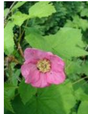
Rubus odoratus