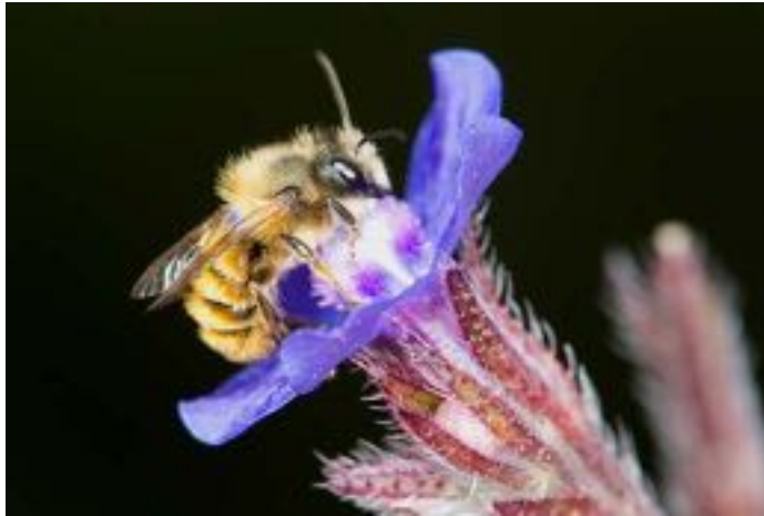
Anchusa azurea & Osmia bicornis © N. Vereecken