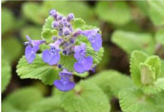
Nepeta racemosa