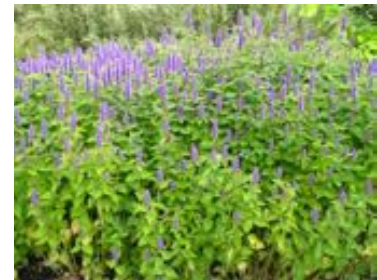
Agastache foeniculum