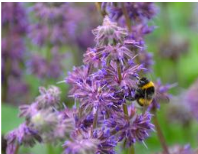
Salvia verticillata & Bombus terrestris