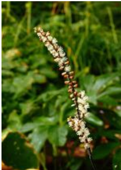
Actaea japonica