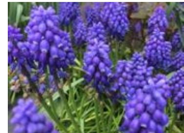
Muscari armeniacum