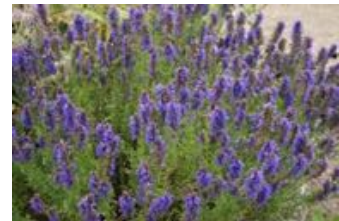
Hyssopus officinalis