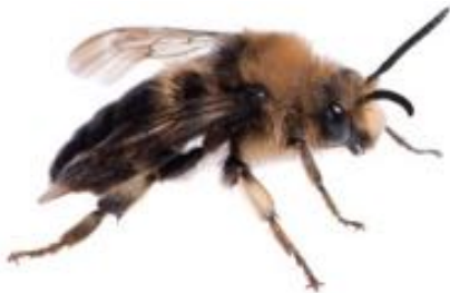
Melecta albifrons femelle