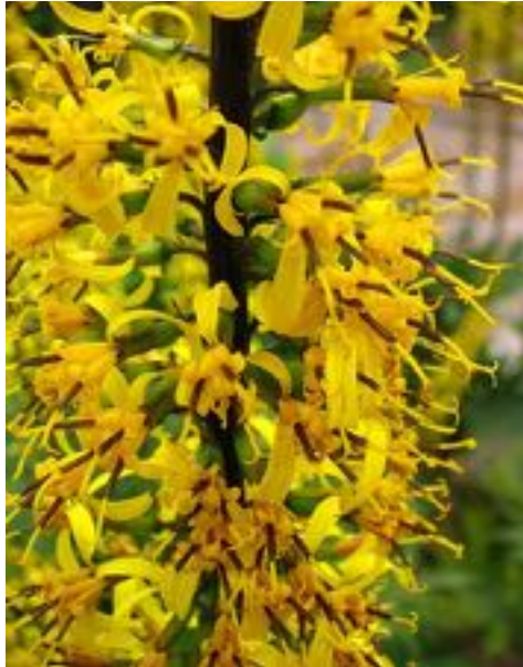
Ligularia przewalskii