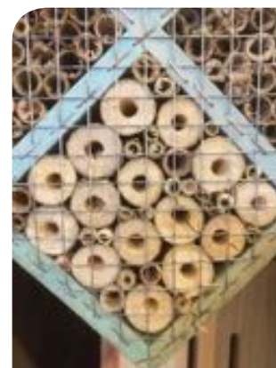
Détail d'un hôtel bon marché : le grillage recouvre une bonne partie des orifices et la structure en bois est très fragile.

Les modèles d'hôtels à insectes proposés dans le commerce ne sont pas toujours très bien conçus et souffrent de défauts qui peuvent les rendre totalement inefficaces, quel que soit leur prix.