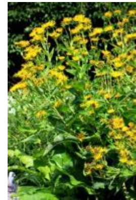
Inula helenium