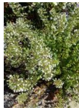
Calamintha nepeta