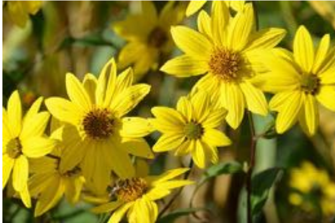
Helianthus microcephalus