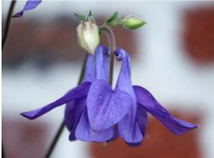
Aquilegia vulgaris © P. Colomb