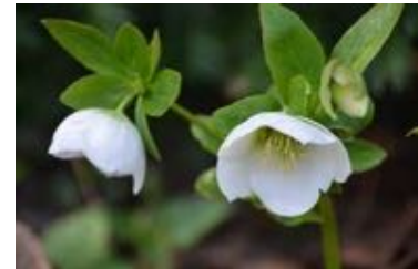
Helleborus orientalis