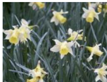
Narcissus pseudonarcissus