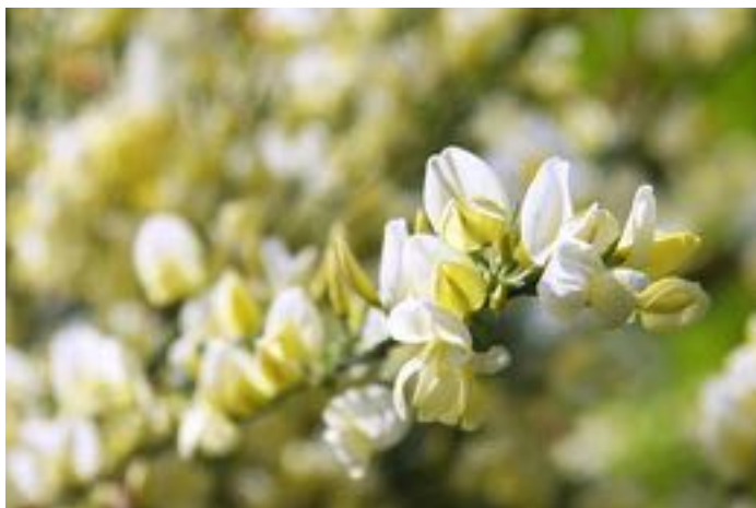
Cytisus praecox