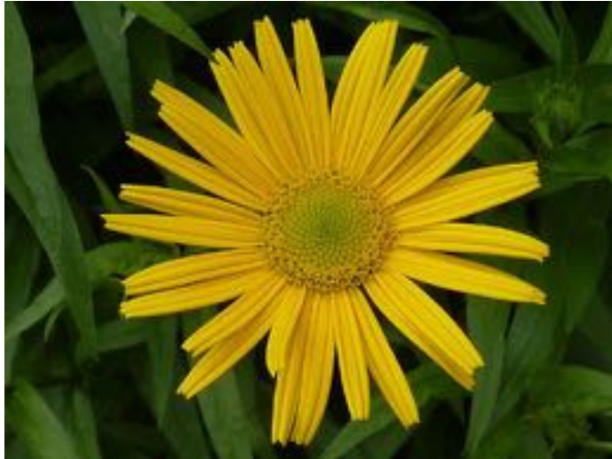
Bupthalmum salicifolium