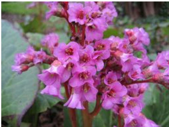
Bergenia cordifolia