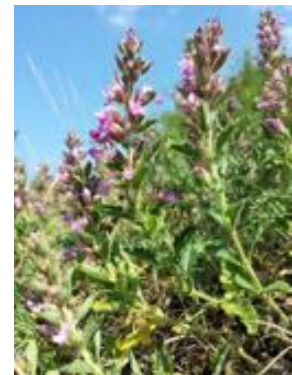
Teucrium chamaedrys