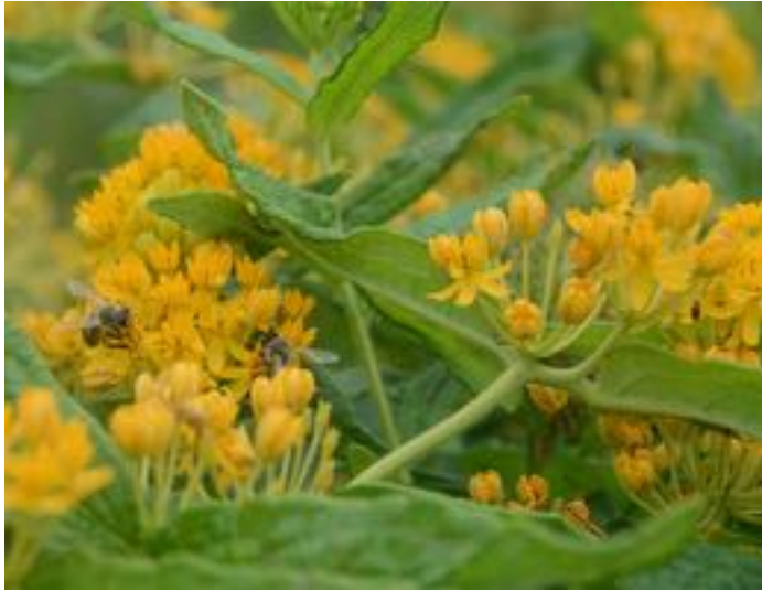
Asclepias tuberosa & Apis mellifera