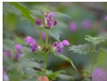
Lamium maculatum