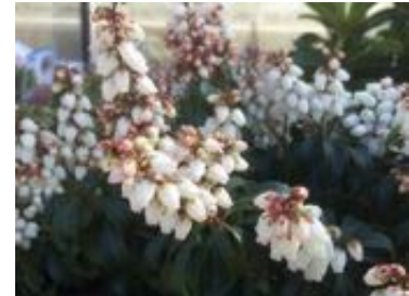
Pieris japonica