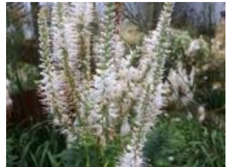
Veronicastrum virginicum «Pink Glow»