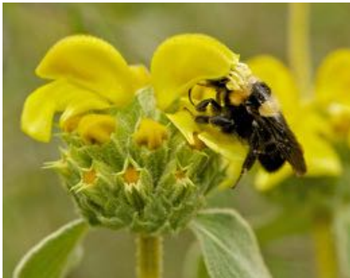
Phlomis fruticosa & Bombus argillaceus