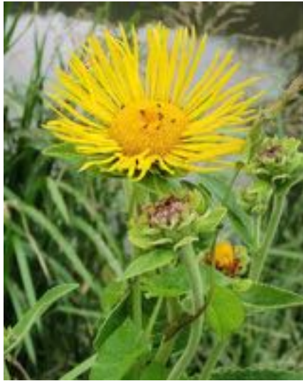
Inula helenium

Grande aunée, inule hélénine, inule aunée