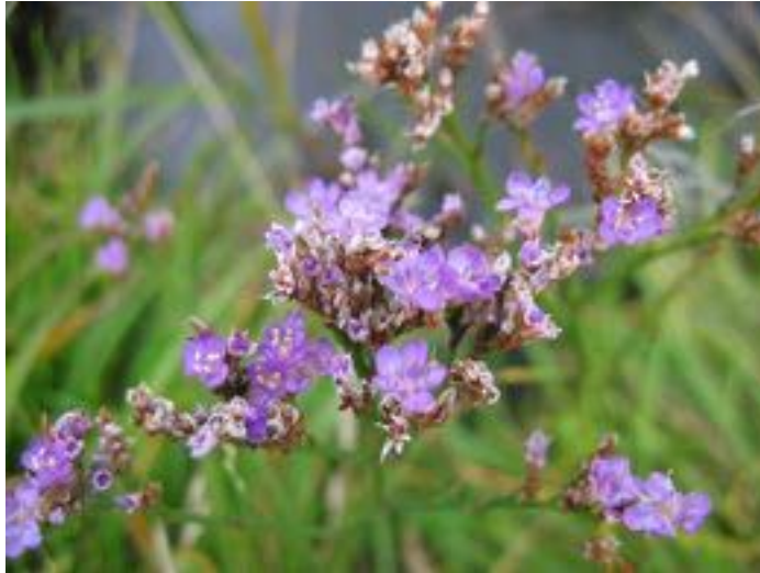
Limonium vulgare