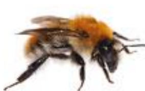
Bombus pascuorum Bourdon des champs