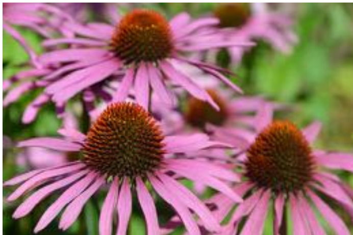
Echinacea purpurea