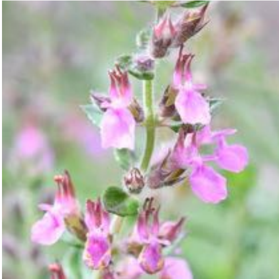
Teucrium chamaedrys