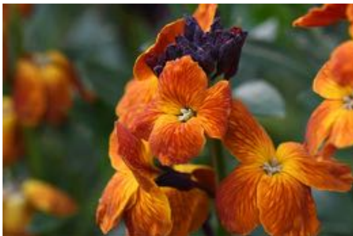
Erysimum cheiri