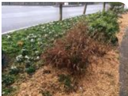
Exemple de massif au fleurissement raisonné

Une bonne connaissance des plantes à fleurs, de leur écologie et de leur développement permet ainsi d'assurer la floraison optimale des parterres qui s'étale alors de la fin de l'hiver à la fin de l'été. Voilà l'assurance d'une source de nourriture disponible aux périodes les plus utiles.