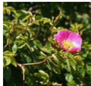
Rosa rubiginosa