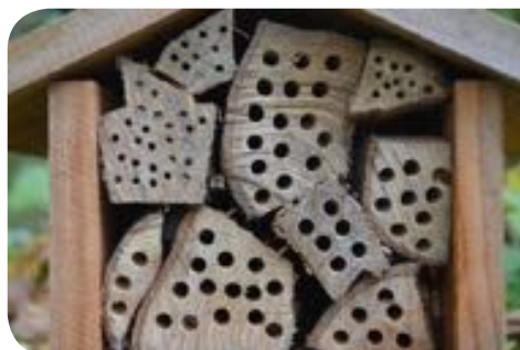
Hôtel adapté pour les espèces caulicoles

Les abeilles rubicoles nidifient dans les tiges contenant de la moelle (roseaux, sureau, etc.) qu'elles creusent elles-mêmes pour construire la galerie dans laquelle elles vont aménager les cellules de leur nid. Les abeilles masquées (genre Hylaeus ) appartiennent à cette catégorie.