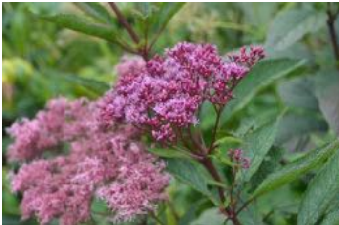
Eupatorium maculatum