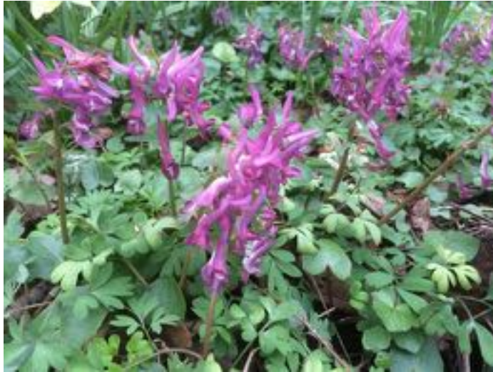
Corydalis solida