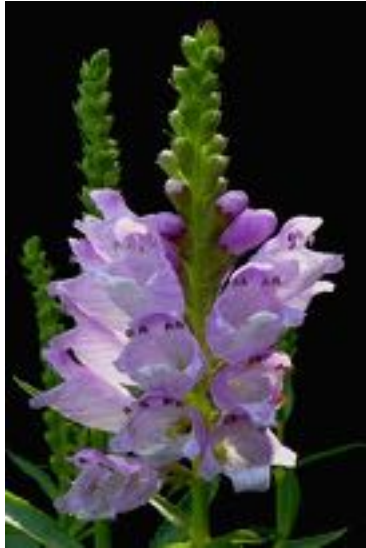
Physostegia virginiana