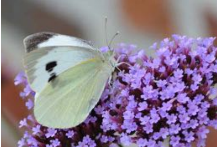
Verbena bonariensis & Pieris sp.