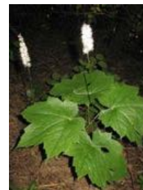
Actaea japonica