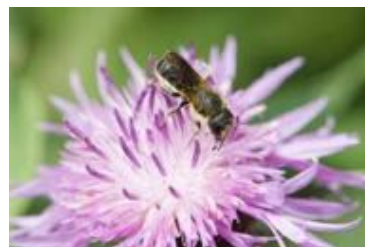
Centaurea thuyllieri & Osmia niveata