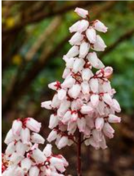
Pieris japonica