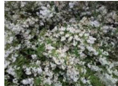
Deutzia gracilis

Plante odorante relativement intéressante pour les bourdons (genre Bombus ), l'abeille domestique et certains papillons du milieu du printemps.