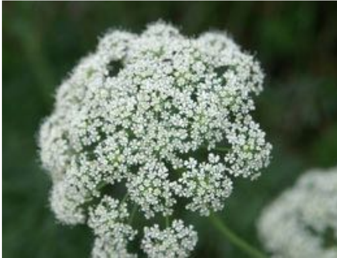
Laserpitium siler