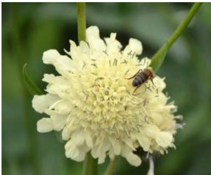
Cephalaria gigantea & Apis mellifera