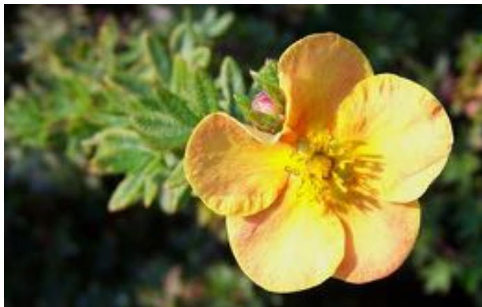
Potentilla fruticosa