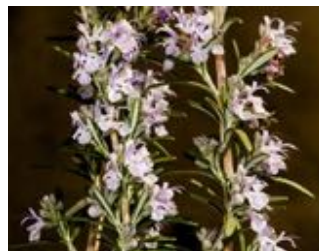
Rosmarinus officinalis