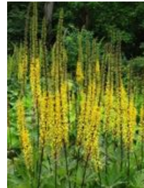
Ligularia przewalskii