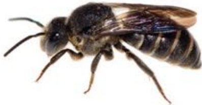
Stelis punctulatissima femelle