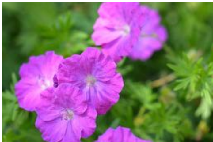
Geranium sanguineum