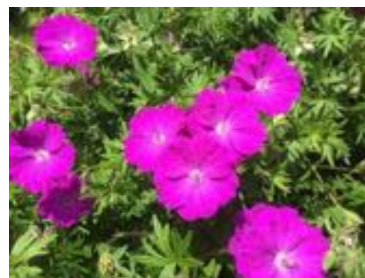
Geranium sanguineum