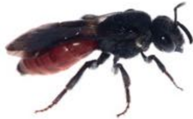
Sphecodes albilabris femelle