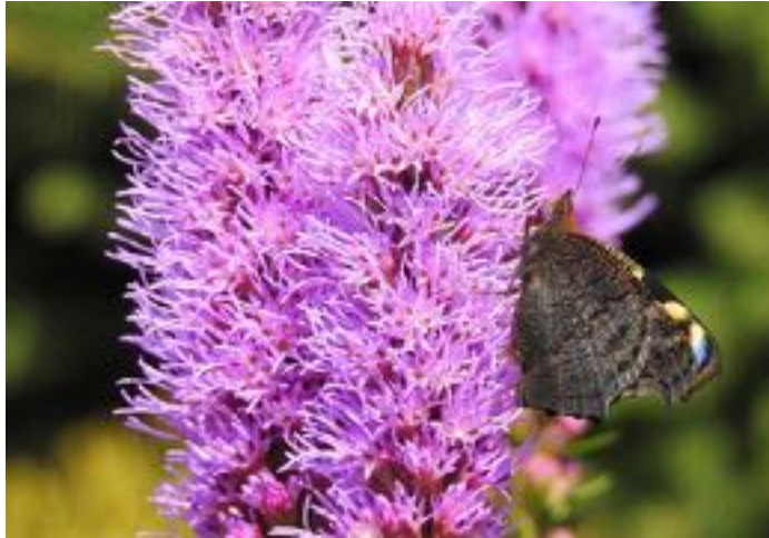
Liatris spicata