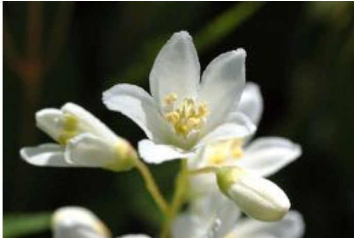
Deutzia gracilis