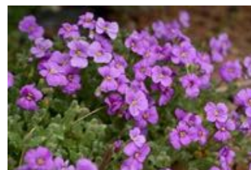
Aubrieta deltoidea - CC BY-SA A. Sulencka

Sa floraison précoce et abondante attire de nombreux pollinisateurs qui émergent au début du printemps, notamment les abeilles sauvages comme les bourdons ( Bombus sp.), les anthophores ( Anthophora sp.), et les andrènes ( Andrena sp.) mais aussi pour toute une série de diptères parmi lesquels les bombyles et les syrphes.