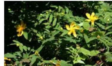
Hypericum calycinum