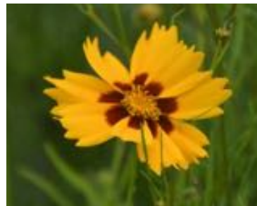
C. grandiflora 'Sonnenkind' © P. Colomb