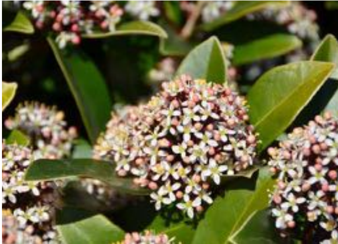
Skimmia japonica