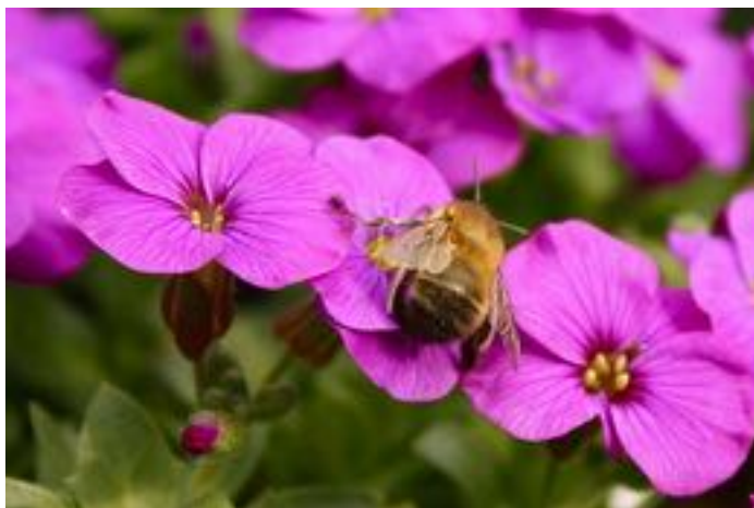
Aubrieta gracilis & Anthophora plumipes