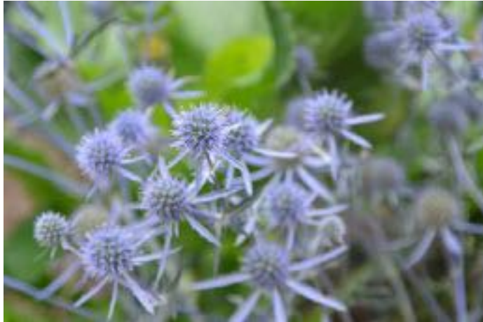
Eryngium planum