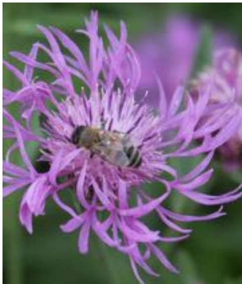
Centaurea thuyllieri & Apis mellifera