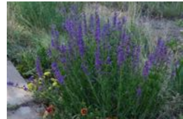
Penstemon sp.