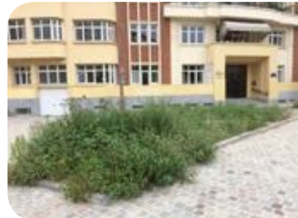
Nouvelle zone de plantation en ville envahie d'adventices

Ces plantes se développent très vite au détriment des jeunes plantations ou des nouveaux semis. Il est dès lors important d'être attentif à l'origine de la terre rapportée pour limiter au maximum les problèmes de mauvaises herbes et de plantes invasives.