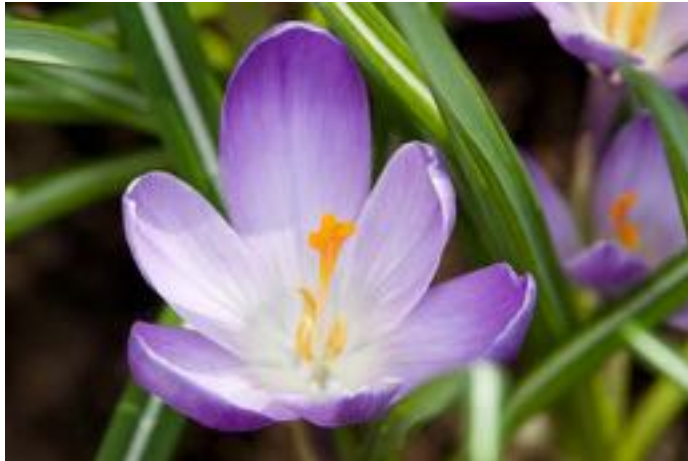
Crocus sp.