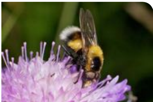
Volucelle bourdon ( Volucella bombylans )