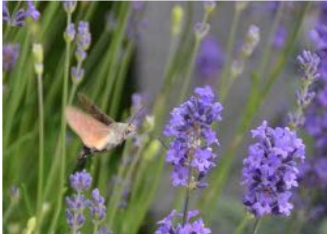
Lavandula angustifolia & Macroglossum stellatarum