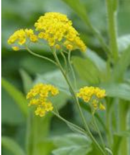
Aurinia saxatilis