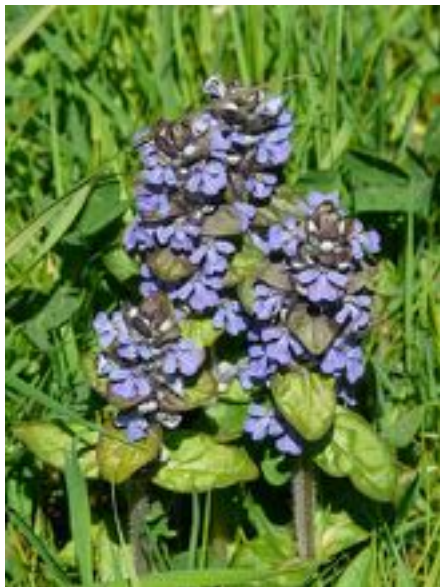
Ajuga reptans