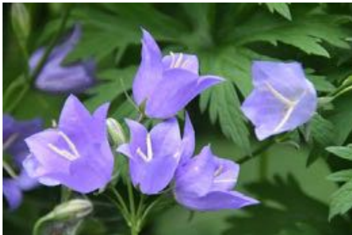
Campanula persicifolia