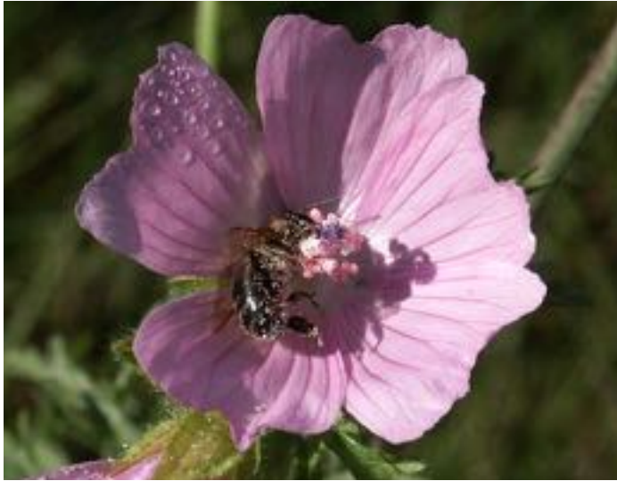
Malva moschata & Apis mellifera