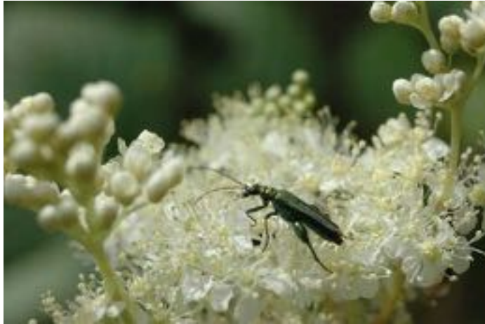
Filipendula ulmaria & Oedemera nobilis