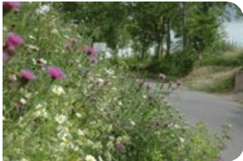
Talus de fleurs sauvages situé le long d'une route