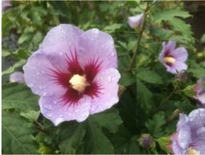
Hibiscus syriacus