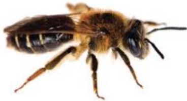
Andrena dorsata femelle