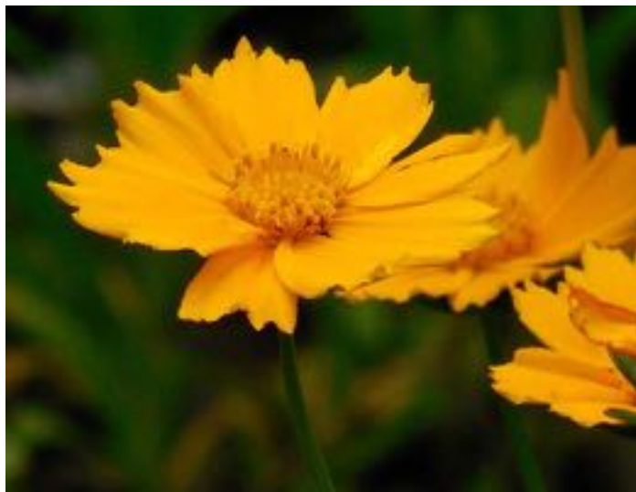
Coreopsis grandiflora