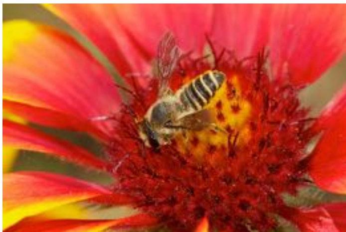
Gaillardia aristata & Megachile