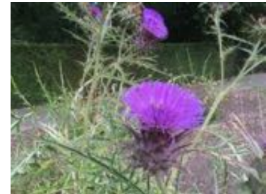
Cynara scolymus