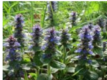
Ajuga reptans