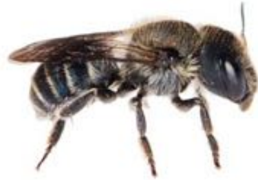
Osmia caerulescens femelle