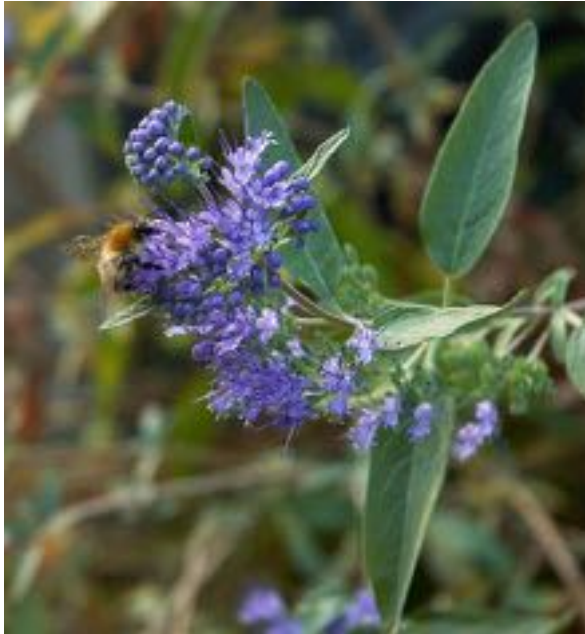
Caryopteris clandonensis