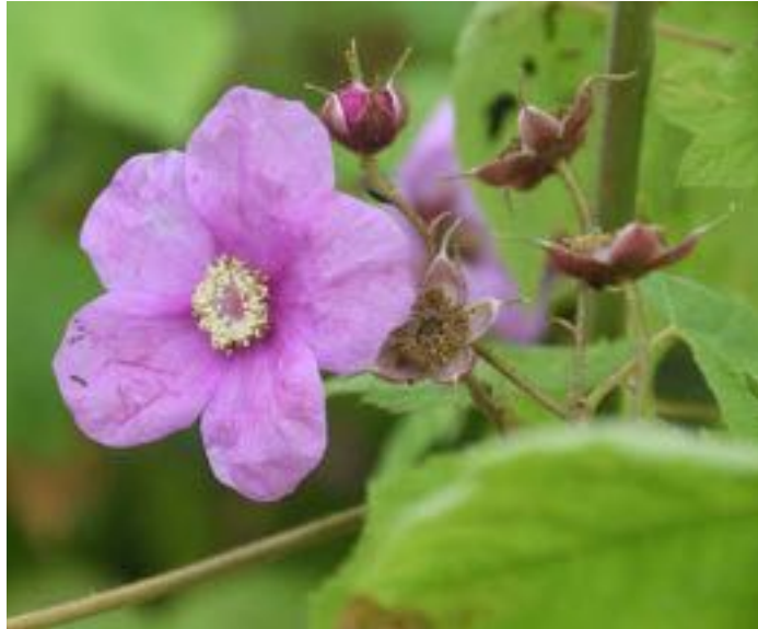
Rubus odoratus