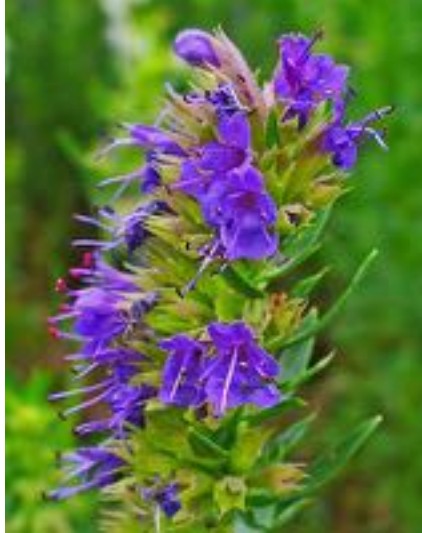
Hyssopus officinalis