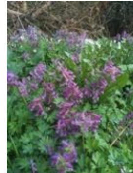
Corydalis solida