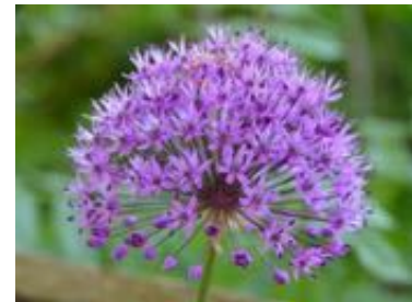
A. aflatumense 'Purple Sensation'