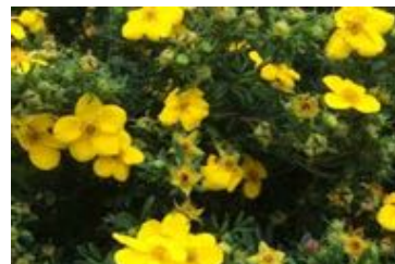
Potentilla fruticosa