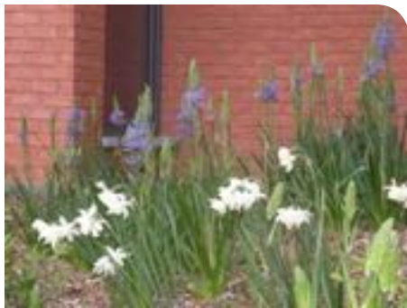
Parterres composés de vivaces et de bulbes, offrant une floraison au printemps et en été

Les bulbes complètent la diversité des massifs et accroissent encore la période de floraison en offrant une floraison précoce. Si les plantes vivaces sont regroupées en taches plus concentriques, les bulbes seront plantés de manière aléatoire à travers les plantes vivaces. La règle s'applique aux plantes à bulbes à développement moyen ( Narcissus sp.) ou important ( Camassia sp., Allium sp., Eremurus , sp., ...) qui seront plantées isolément ou par groupes de deux ou trois au maximum. Les bulbes à croissance plus modeste, tels que les muscaris ( Muscari sp.) ou les crocus ( Crocus sp.), seront quant à eux plutôt regroupés par trois, cinq ou sept bulbes, pour un meilleur effet visuel, et répartis à travers les plantations de vivaces. Ainsi, en saison estivale, les vivaces occuperont l'espace laissé par les plantes à bulbes, tout en évitant de créer des espaces dénudés dans le parterre.