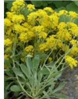
Aurinia saxatilis