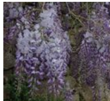
Wisteria sinensis