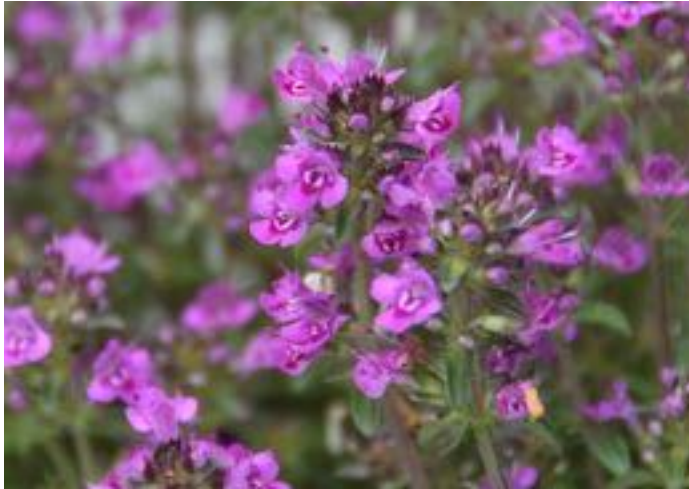
T. praecox 'Coccineus'