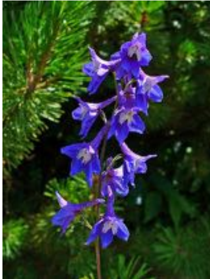
Delphinium elatum