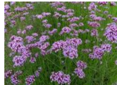
Verbena bonariensis

Plante à la floraison estivale très spectaculaire. Les fleurs très nombreuses sont nectarifères. Cette verveine attire l'abeille domestique mais aussi les bourdons (genre Bombus ) et s'avère également intéressante pour les papillons et les syrphes pendant la période estivale.