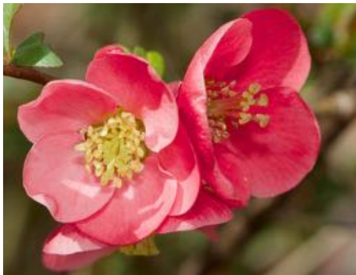
Chaenomeles japonica