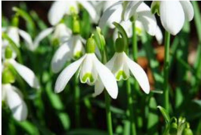
Galanthus nivalis