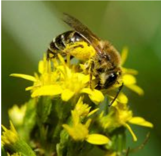
Solidago virgaurea & Colletes sp.