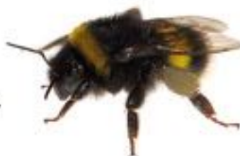
Bombus terrestris Bourdon terrestre