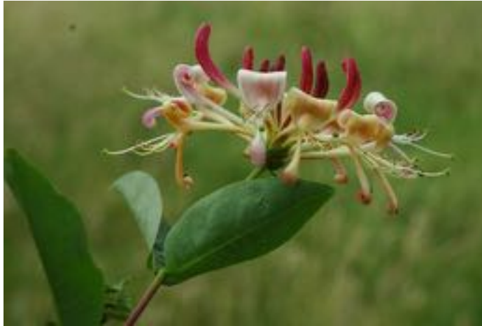
Lonicera perelymenum