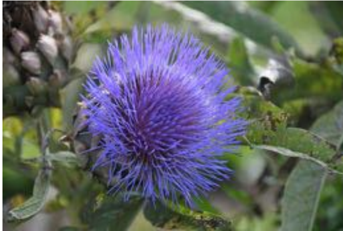
Cynara scolymus