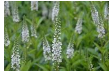
Lysimachia fortunei