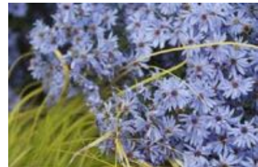
Aster cordifolius