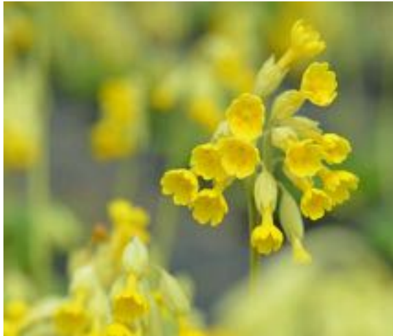
Primula veris