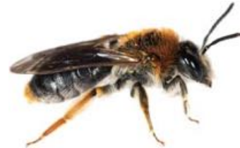
Andrena haemorrhoa femelle