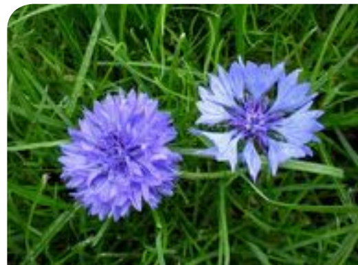
Le bleuet des champs : à gauche variété horticole double, à droite l'espèce sauvage

Enfin, pas moins d'une soixantaine de plantes exotiques ou de cultivars horticoles sont présentées avec quelques déclinaisons de variétés courantes. Attention de toujours bien choisir des variétés à fleurs simples. Les variétés horticoles à fleurs doubles ne présentent en effet aucun intérêt pour les pollinisateurs. Ces fleurs sont tellement complexes que les abeilles n'ont plus accès à la source de nourriture. Celle-ci est par ailleurs très réduite car cette forme de fleurs provient de la transformation d'étamines en pétales. Dans le cas d'inflorescences, il s'agit alors d'un ensemble de fleurs, des fleurs fertiles sont transformées en fleurs stériles. L'inflorescence est alors plus expressive, mais sa complexité réduit fortement la source de nectar et de pollen. Tel est le cas, par exemple, des variétés de bleuets à fleurs doubles.