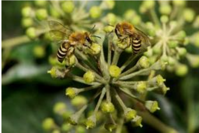
Hedera helix & Colletes hederae