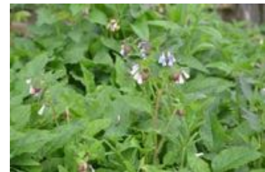
Symphytum grandiflorum