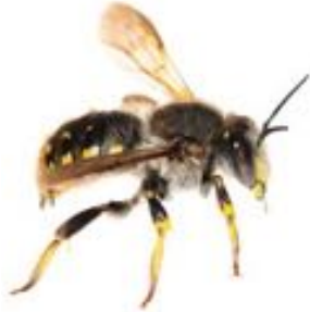
Anthidium manicatum mâle