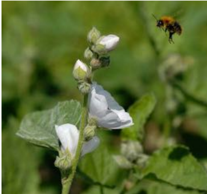
Althaea officinalis