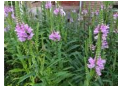
Physostegia virginiana