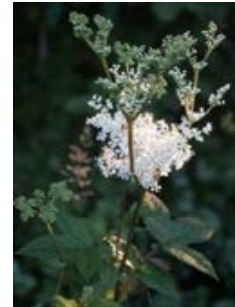
Filipendula ulmaria