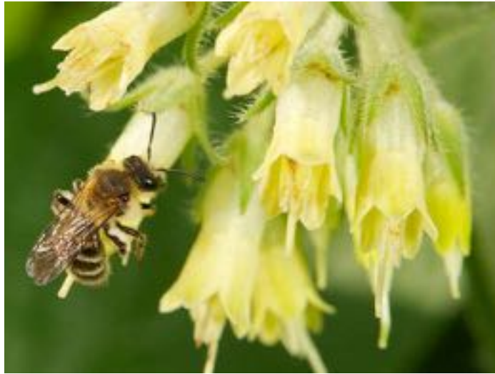
Symphytum grandiflorum & Andrena symphyti