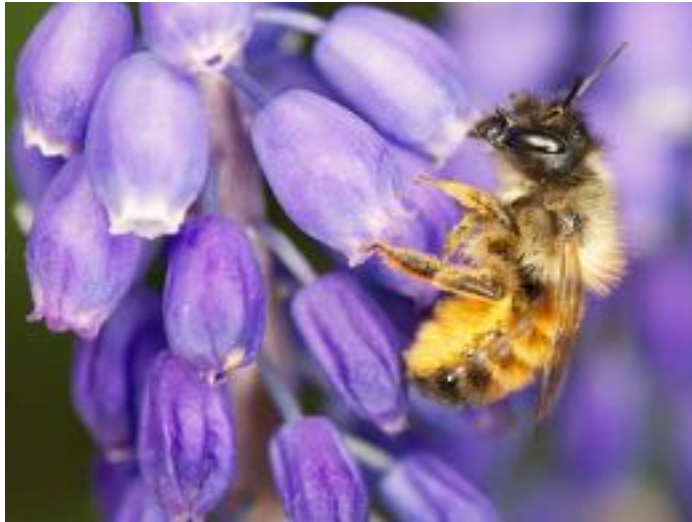
Muscari armeniacum & Osmia bicornis © N. Vereecken