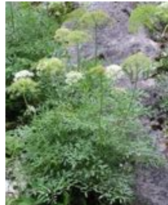
Laserpitium siler