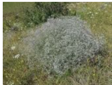
Gypsophila paniculata