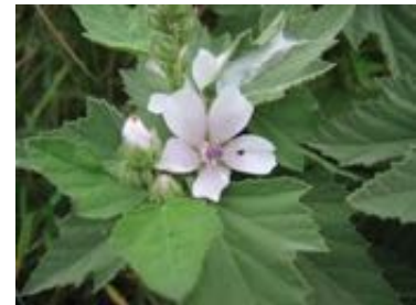
Althaea officinalis