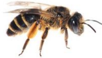
Andrena flavipes femelle