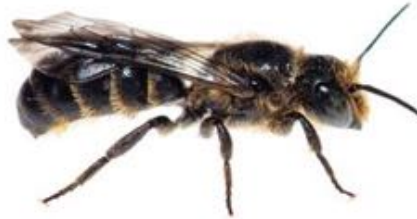
Chelostoma rapunculi mâle