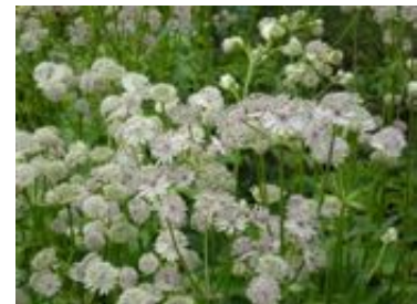
Astrantia major