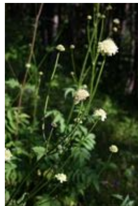
Cephalaria gigantea