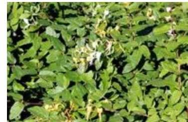
L. perelymenum 'Belgica'