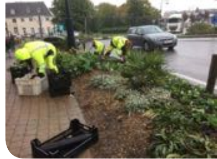
Plantation d'un parterre composé de vivaces et de bulbes

Il est conseillé de jeter les bulbes au sol et de les planter là où ils sont tombés. Les distances de plantation seront ainsi le fruit du hasard donnant une scène plus naturelle.