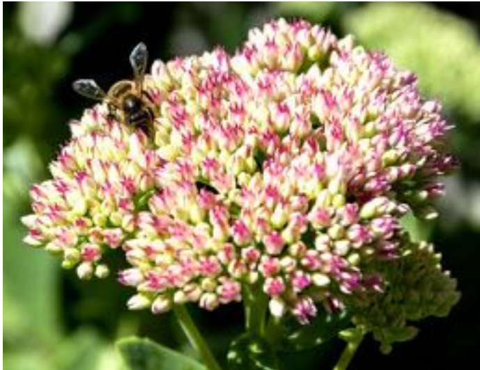
Sedum spectabile & Apis mellifera