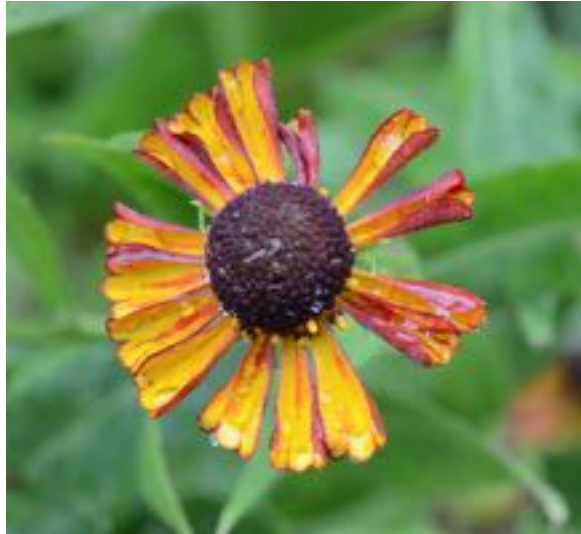
Helenium species