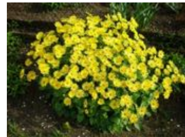
Doronicum orientale