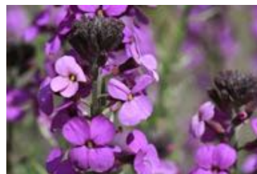
Erysimum 'Bowles Mauve'