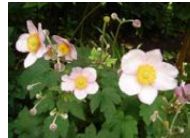
Anemone hupehensis