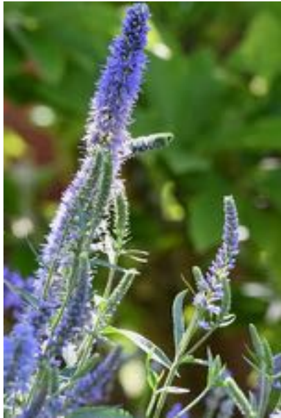
Veronica longifolia