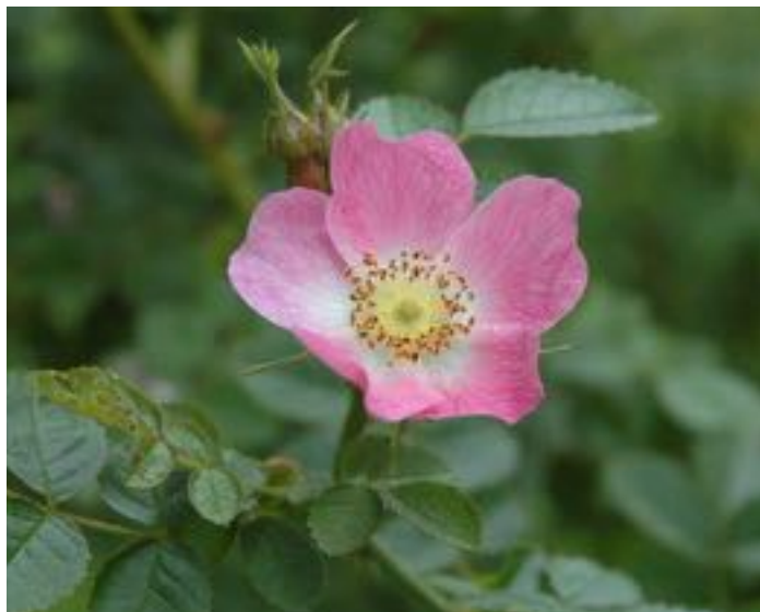
Rosa rubiginosa