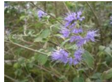
Caryopteris clandonensis