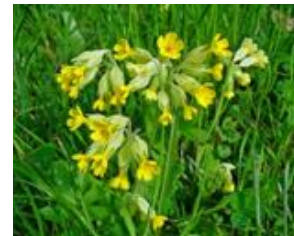
Primula veris