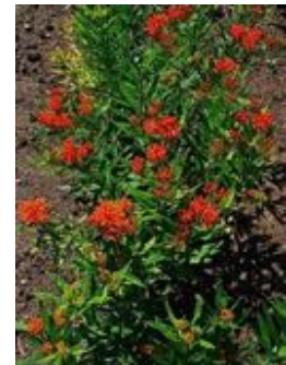
Asclepias tuberosa