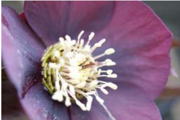
Helleborus orientalis - © P. Colomb