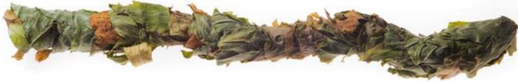
Cigare de mégachile

D'autres espèces, telles que les hériades, utilisent de la résine végétale pour sceller l'entrée de leur nid, tandis que les anthidies entourent leurs cellules larvaires d'une masse cotonneuse constituée de poils récoltés sur les tiges et les feuilles de certains végétaux .