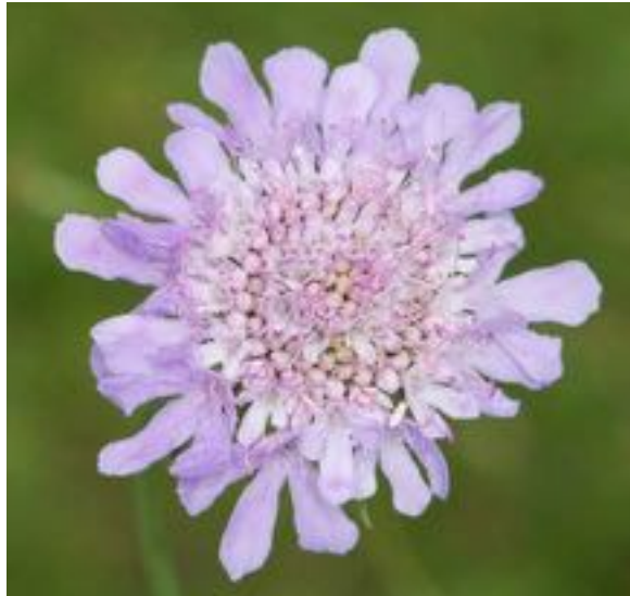
Scabiosa columbaria