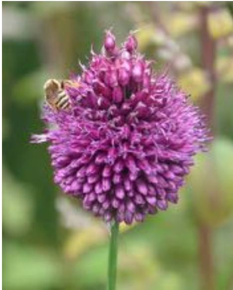
Allium sphaerocephalon & Halictus scabiosae