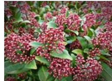
Skimmia japonica