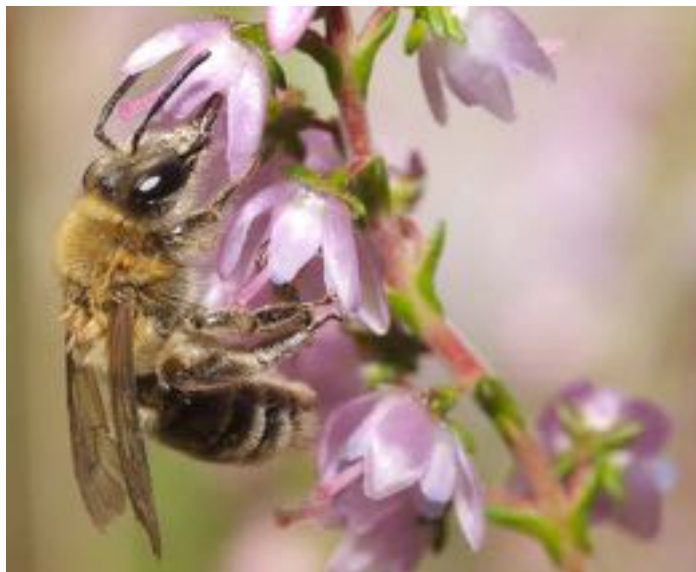
Calluna vulgaris & Andrena fuscipes