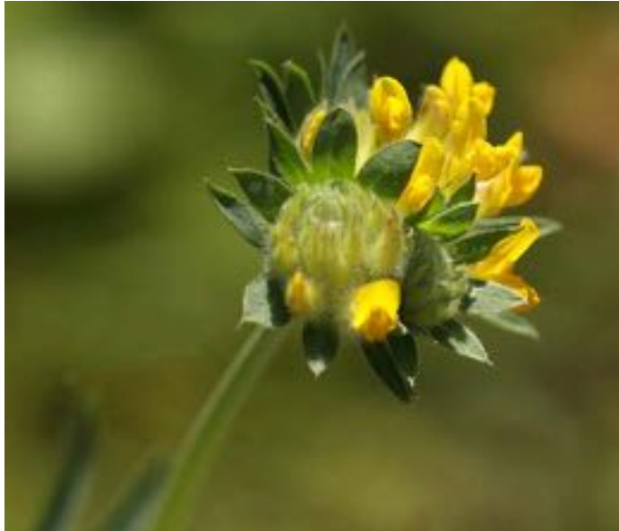
Anthyllis vulneraria