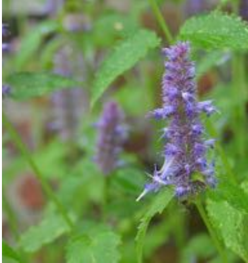
Agastache foeniculum