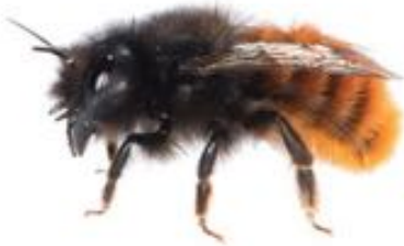
Osmia cornuta femelle