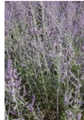
Perovskia atriplicifolia