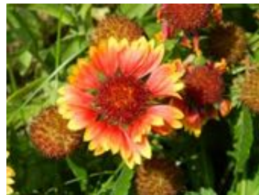
Gaillardia aristata