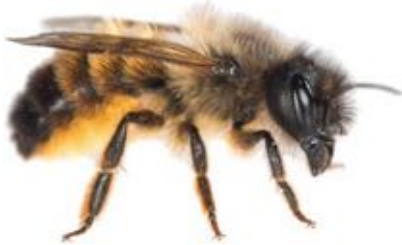
Osmia bicornis femelle