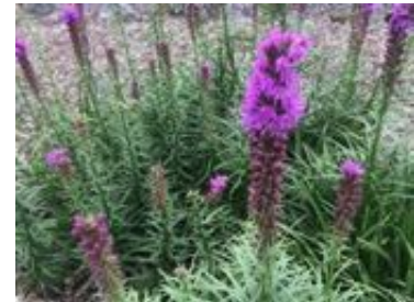
Liatris spicata