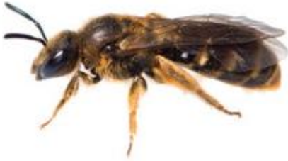
Lasioglossum calceatum femelle