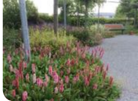
Parterre de Persicaria amplexicaulis

Il est souvent conseillé d'implanter les plantes d'une même espèce en nombre impair.