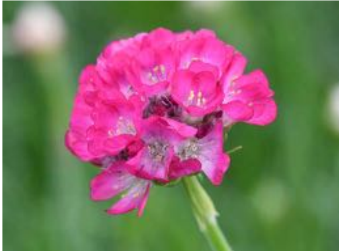
Armeria maritima