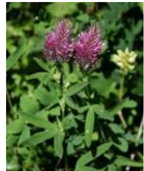
Trifolium rubens