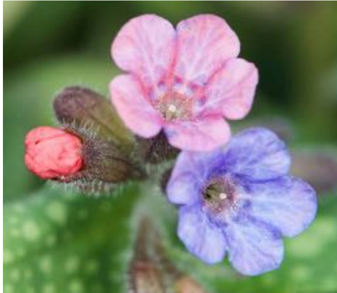
Pulmonaria officinalis - © N. Vereecken