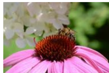
Echinacea purpurea