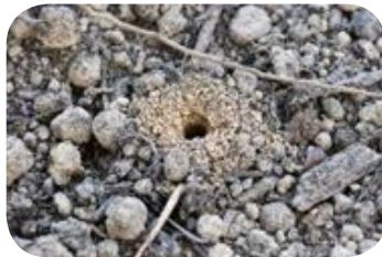
Zone d'accueil pour les abeilles terricoles

- les espaces sableux ou à sol présentant des zones légèrement dégarnies ou clairsemées de végétation, comme les talus, qui sont également essentiels pour la grande majorité des abeilles sauvages qui sont terricoles , c'est-à-dire qu'elles font leur nid exclusivement dans le sol. Chaque femelle creuse ainsi une galerie principale souterraine de quelques centimètres à quelques dizaines de centimètres de profondeur, d'où rayonnent des galeries périphériques qui mènent aux cellules larvaires.