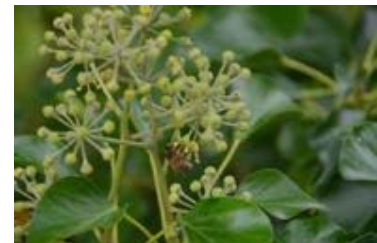
Hedera helix