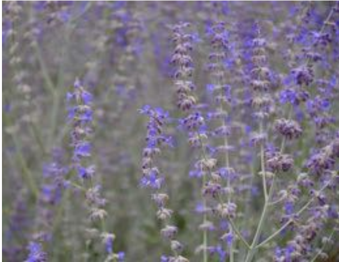
Perovskia atriplicifolia