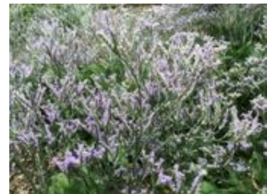
Limonium vulgare