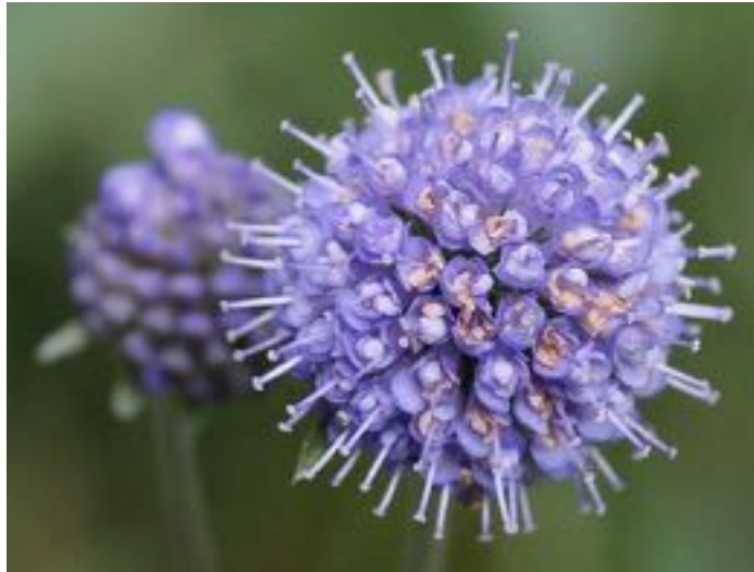
Succisa pratensis