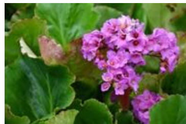
Bergenia cordifolia