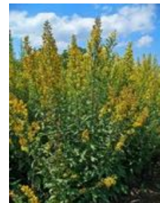
Solidago virgaurea