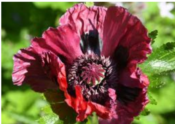
Papaver orientale