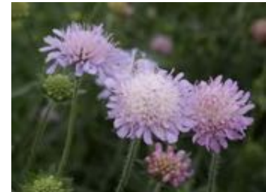
Knautia arvensis

Les inflorescences plates et larges constituent une véritable piste d'atterrissage florale pour les pollinisateurs comme les bourdons (genre Bombus ), les lasioglosses et halictes (genres Lasioglossum et Halictus ), les anthidies (genre Anthidium ). Il existe deux espèces d'andrènes ( Andrena hattorfiana et A. marginata ) protégées dans nos régions, qui dépendent exclusivement de ces plantes pour leur approvisionnement en pollen. Les syrphes, papillons et l'abeille domestique visitent également cette plante.