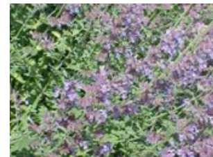
N. faassenii