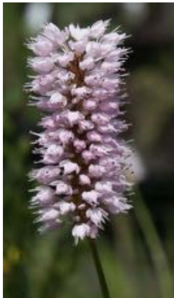
Persicaria bistorta