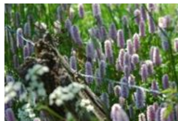
Persicaria bistorta