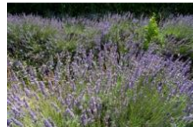
Lavandula angustifolia