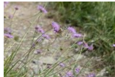
Scabiosa columbaria