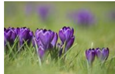
Crocus sp.

La floraison précoce de cette espèce attire les pollinisateurs qui émergent au tout début du printemps, notamment les abeilles sauvages comme les bourdons ( Bombus sp.), et les osmies ( Osmia sp.), mais aussi toute une série de diptères parmi lesquels les bombyles et les syrphes.