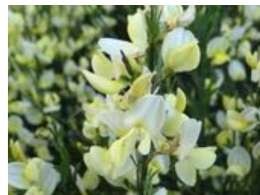
Cytisus praecox «Albus»