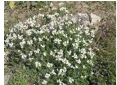
Arabis caucasica