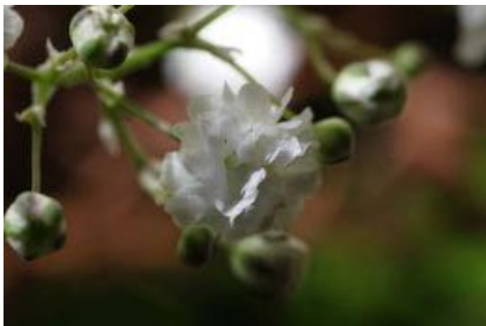
Gypsophila paniculata