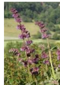
Salvia verticillata