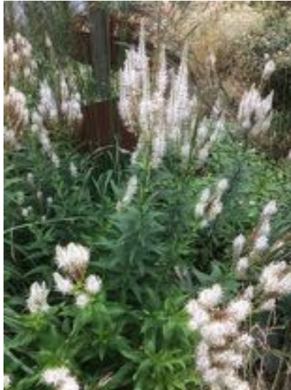
Veronicastrum virginicum