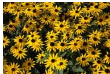
Rudbeckia fulgida