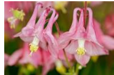
Aquilegia vulgaris