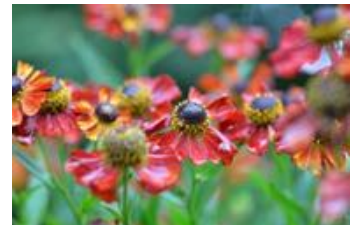
Helenium species

Les hélénies sont des plantes à floraison estivale qui présentent des fleurs très accessibles et intéressantes pour de nombreux pollinisateurs, y compris des espèces spécialisées sur les Astéracées comme les hériades (genre Heriades ) et les collètes (genre Colletes ), mais aussi les halictes (genres Halictus et Lasioglossum ), de nombreux syrphes et certains papillons.