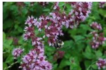
Origanum vulgare