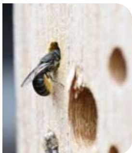
Hôtel composé de galeries creusées, idéal pour les larves de coléoptères et les abeilles sauvages

Les espèces caulicoles nidifient dans des espaces creux, de préférence en forme de galerie, comme les tiges creuses, les espaces entre les briques ou les pierres, les galeries creusées dans le bois par d'autres insectes (larves de coléoptères par exemple), l'espace entre le bois et l'écorce, les trous dans le sol laissés par les racines d'un arbre déraciné, ... Les osmies comme l'osmie cornue ( Osmia cornuta ) et l'osmie rousse ( Osmia rufa ), ainsi que les mégachiles appartiennent à cette catégorie d'abeilles sauvages.