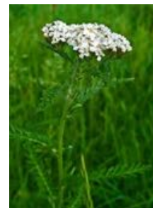
Achillea millefolium