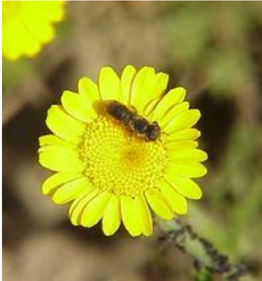
Anthemis tinctoria & Lasioglossum sp.