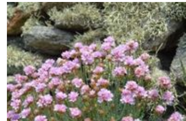
Armeria maritima