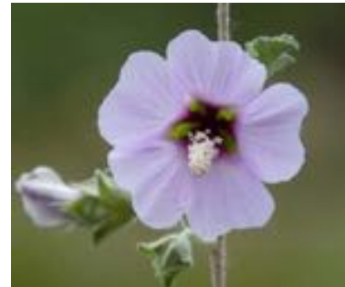
Hibiscus syriacus