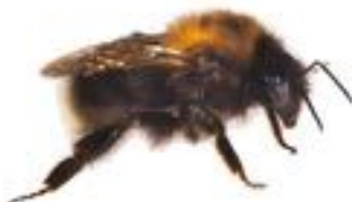
Bombus hypnorum Bourdon des arbres