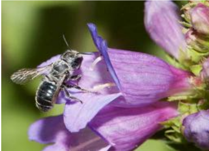
Penstemon sp. & Osmia caerulea © N. Vereecken