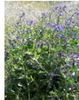
Anchusa azurea