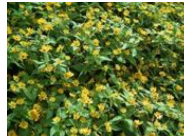
Helianthus microcephalus - CC BY-SA Rameshug